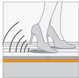
Reflectiegeluid (RWS) 15 %