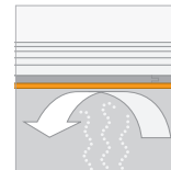
Bescherming tegen vocht (SD) \geq 100 meter