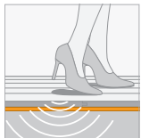
Contactgeluidisolatie (IS) 10 dB \Delta L_{lin}