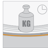
Langdurige belasting (CC) \geq 10 kPa