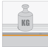
Kortstondige belasting (CS) \geq 50 kPa